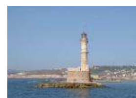
Un éclairage extérieur peut parfois aider.