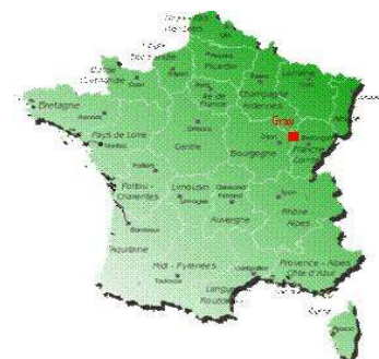
Située entre Besançon et Dijon, APN intervient dans toute la France.

Vous trouverez des compléments d'information sur notre site Internet.