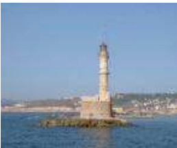
Un éclairage extérieur peut parfois aider.

Ces prestations forfaitaires peuvent être complétées de jours de travail pour évaluer ou développer une solution technique, une notice ou une formation particulière.